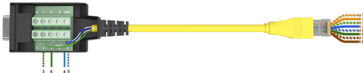
Рисунок 1 – Соединения разъемов консольного кабеля RJ45-DB9

Для проведения работ по установке ПО СМ, произведите подключение АРМ к аппаратной платформе СМ посредством консольного кабеля RJ-45–DB9 (рисунок 1).