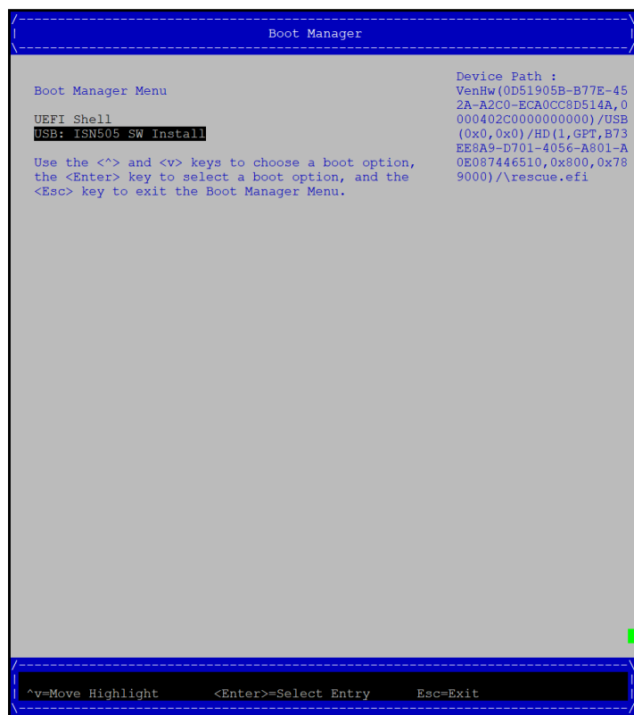
Рисунок 2 – Меню загрузки

В меню загрузки выберите пункт «USB: ISN505 SW Install» и нажмите на клавишу «Enter» (рисунок 2):