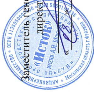
График одобрен научно-экспертным советом протокол № 98 от 05.04.2022